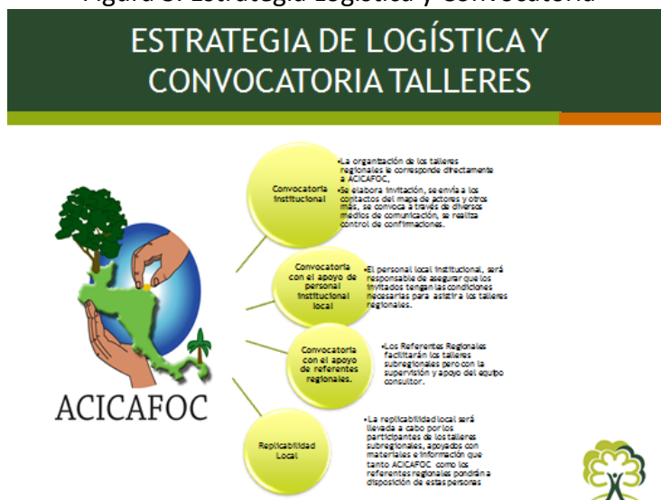
Figura 3. Estrategia Logística y Convocatoria

Nuevamente, y vinculado a la estrategia de comunicación, el abordaje metodológico para convocar e informar siguió este proceso: